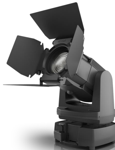
G4 MOTORIZED BARNDOORS